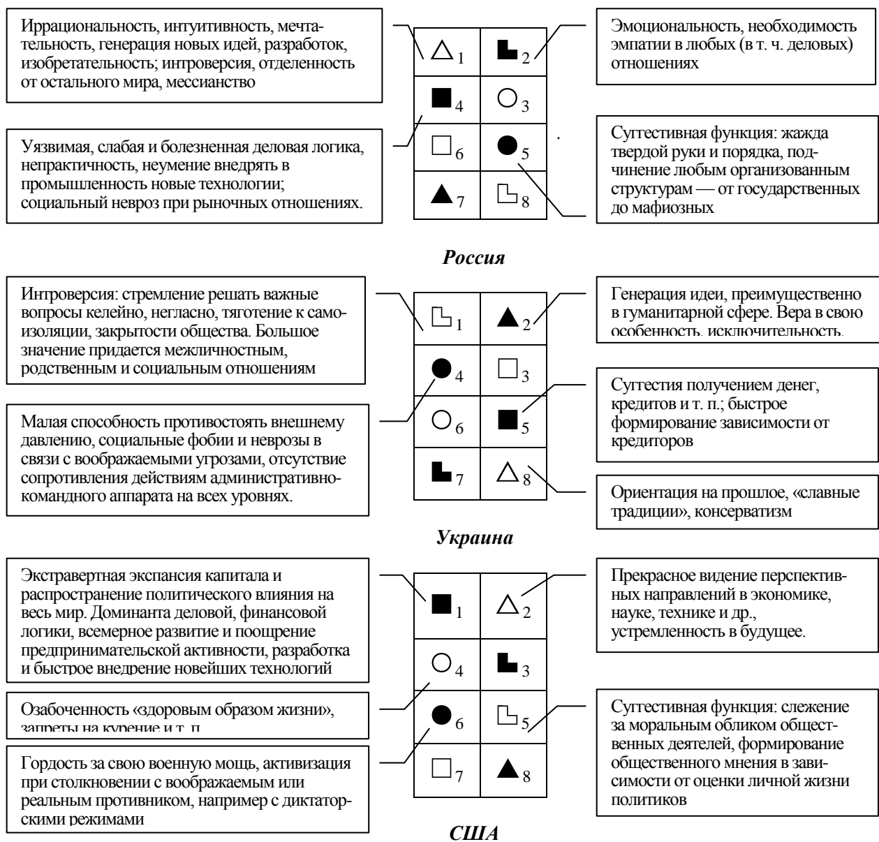
Рис.1. Фрагменты моделей ментальности этносов России, Украины и США

В настоящее время в МИС подробно исследованы психоинформационные структуры большинства крупных этносов и государств Европы, Америки и Азии, построены эффективные психоинформационные модели их функционирования, которые хорошо описывают процессы, происходящие в этих странах. В качестве примера на рис. 1 приведены структуры этносов России, Украины и США. Хорошо видны сильные стороны этноса и его проблемы. Так, деловая, денежная логика (■) в психоинформационной структуре США является ведущей функцией восприятия и действия американской ментальности, что определяет уровень развития экономики этой страны и ее ведущую роль в этой сфере на мировом уровне [9]. В то же время в психоинформационной структуре России или Украины эта функция находится в зоне проблем, — отсюда и сложности с реализацией экономических реформ в отсутствие целенаправленной программы психоинформационной адаптации страны к реформам [11].