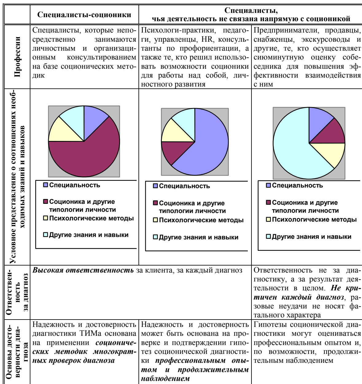
Таблица. 1. Необходимость в достоверной диагностике и ответственность за диагноз.

Каждый такой «подогнанный по руке» специалиста инструмент [6,7] должен позволять решать определенную задачу от начала до конца, с прохождением следующих этапов: диагностика, включающая проверку диагноза, анализ результатов диагностики, выбор своей модели поведения или рекомендаций для партнера, клиента, произведение необходимых действий в соответствии с полученными выводами.