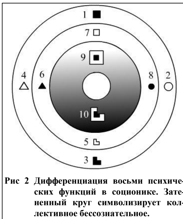
Рис 2 Дифференциация восьми психических функций в соционике. Затененный круг символизирует коллективное бессознательное.

Таким образом, внутренний круг обозначает воссоздание самости , а внешние фигуры показывают способ интеграции самости в сознание. Квадрат в данном случае символизирует последующий синтез четырех составляющих информационного потока (способ осознания самости ), а треугольник — соединение единичной целостности с космическим сознанием, которое образует внешняя окружность. Треугольник также можно рассматривать