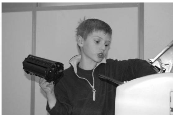
Г. \bigcirc \blacksquare (СЛИ) (5 лет)