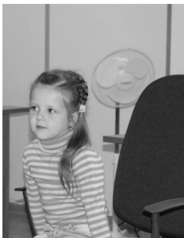
Б. \triangle \blacksquare (ИЛИ) (4 года)