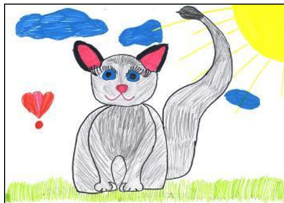
Б. Девочка-□● (8 лет).