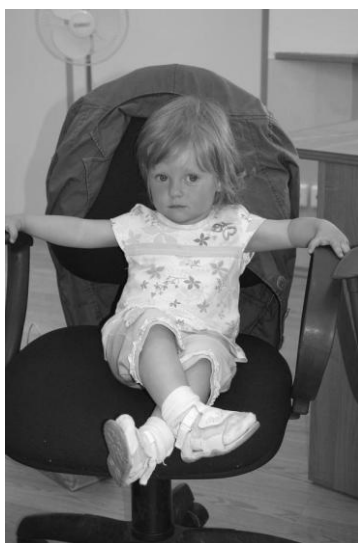
Б. \blacksquare \bigcirc (ЭСЭ) (2 года)