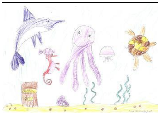
В. Девочка-■○ (7 лет).