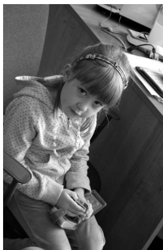
А. \triangle \blacksquare (ИЭИ) (5 лет)

Интуиты же, наоборот, часто сидят на краешке стула (см. рис. 4).