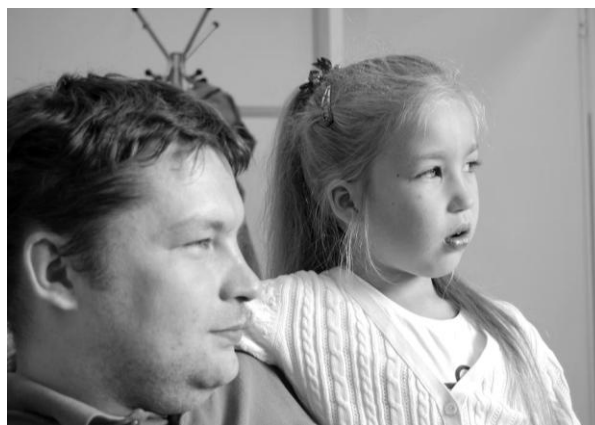
Б. ○■ (СЛИ), △■ (ИЭИ) (8 лет)