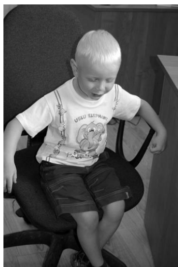
А. \bigcirc \blacksquare (СЛИ) (4 года)

Сенсорика и интуиция тоже достаточно хорошо просматриваются внешне. Сенсорные дети всегда удобно располагаются в кресле, занимая «свою территорию» (см. рис. 3).