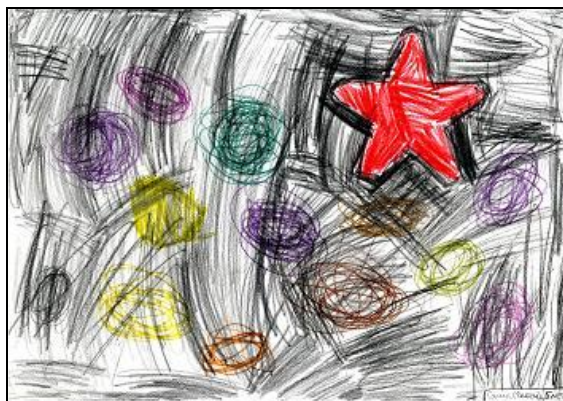
А. Мальчик-О■ (5 лет).