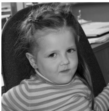
А. \Delta \blacksquare (ИЛИ) (4 года)

В свою очередь, детям-логикам интересно, как устроена техника. В этом мы смогли убедиться воочию (см. рис. 2.Г — Д).