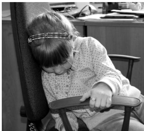
Б. \triangle\blacksquare (ИЭИ) (5 лет)