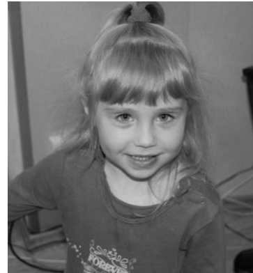
В. \blacktriangle \square (ИЭЭ) (4 года)