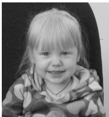
Б. \Delta \blacksquare (ИЛИ) (2 года)