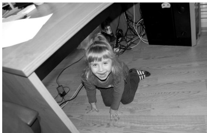
В. \blacktriangle\blacksquare (ИЭЭ) (4 года)