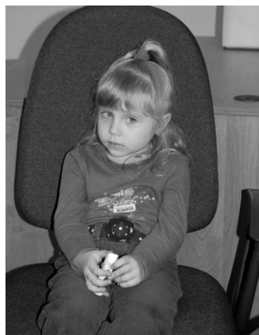
В. \blacktriangle \square (ИЭЭ) (4 года)