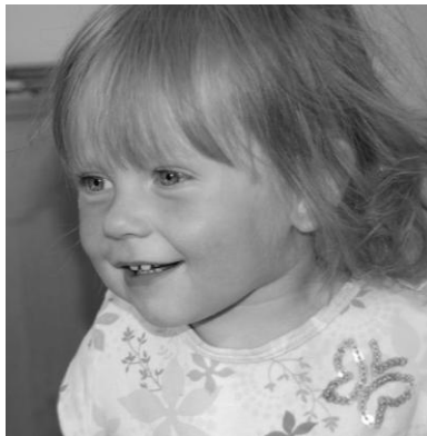
Б. \blacksquare \bigcirc (ЭСЭ) (2 года)