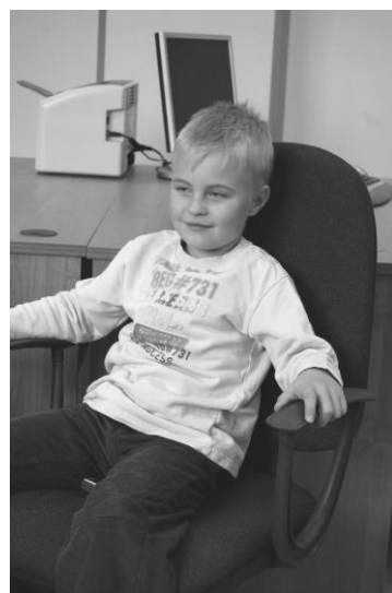
В. \blacksquare \bigcirc (ЛСЭ) (7 лет)