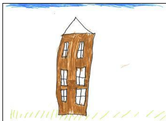
Б. Мальчик-■△ (6 лет).