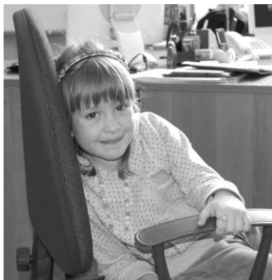
А. \Delta \blacksquare (ИЭИ) (5 лет)