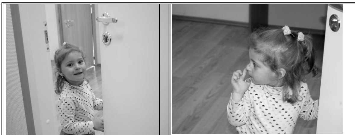
Г. ■△ (ЛИЭ) (2 года)