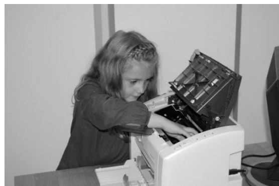
Д. \blacksquare \bigcirc (ЛСЭ) (7 лет)