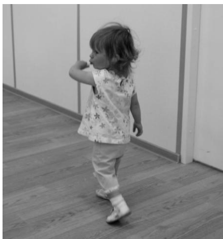
А. \blacksquare\bigcirc (ЭСЭ) (2 года)

Интроверты сидят на месте, взгляд туннельный, могут подолгу играть сами с собой (см. рис. 7).