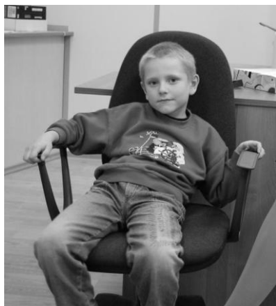
А. \bigcirc\blacksquare (СЭИ) (6 лет)