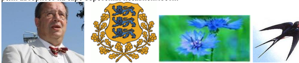
Рис. 1. Президент Х.Т. Ильвес.

Предполагаем, что президент страны — представитель ЭСИ. Этот ТИМ находится в деловых интертипных отношениях с интегральным типом страны. До избрания он был депутатом Европарламента от социал-демократической партии, многие лидеры которой приобрели авторитет на заре обретения независимости.