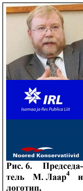
Рис. 6. Председатель М. Лаар 4 и логотип.