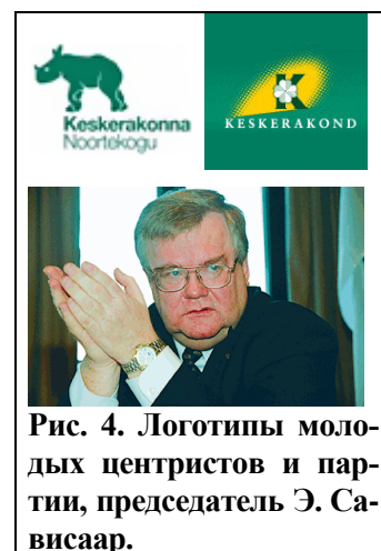
Рис. 4. Логотипы молодых центристов и партии, председатель Э. Сависаар.

Предпочтение зеленого цвета свидетельствует о твердости характера лидеров, инертности и самоуправлении. Цвет считается маскулинным и соотносится с соционическими функциями □ и ○ (Гуленко). (Эти функции в формуле ИЛИ контактные, точнее — ролевая и демонстративная). В. Элькин описывает психологический портрет чрезмерности во-