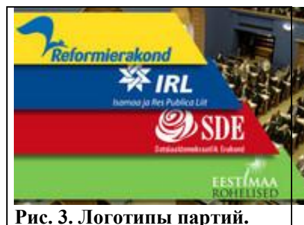
Рис. 3. Логотипы партий.

3. Воспользуемся шкалой «левый тоталитаризм–революция–социал-демократия–либеральная демократия–консервативная демократия–контрреволюция–правый тоталитаризм» для определения ценностных ориентиров партии, которые охарактеризуем с помощью ключевых слов (таблица 1).