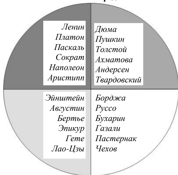
Рис. 3. Места психотипов среди стилей.

Классификация по стилям общения не учитывает Физики . Примеры: Лао-Цзы — 3-я Физика . Многим, кто тестировал этот тип, приходилось встречать семантическое доминирование (т. е. навязывание категорий мышления). Но наверняка дело было в том, что типизируемый не был расположен к диагностике! Все-таки Физика — уязвимая функция. Однако если расположить типизируемого к себе, его поведение будет более естественным. Поэтому к пограничным типам могут относиться: Пастернак (между Моторами и Поддержкой ), Лао-Цзы (между Аналитиками и Контролерами ), Ленин и Толстой (между Моторами и Контролерами ).