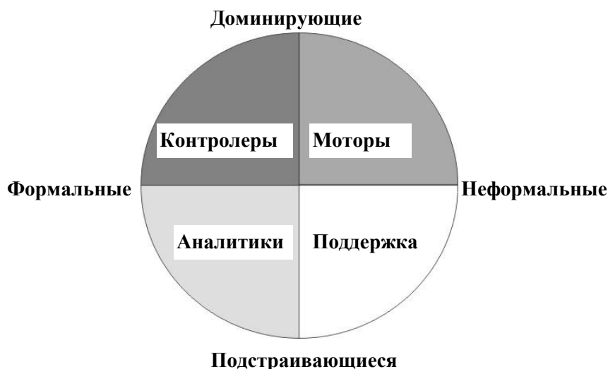
Рис. 2 Коммуникативные стили.

Распишем психотипы по стилям общения (см. табл. 1а, правая колонка)