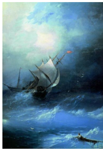
Буря на Ледовитом океане 1864 г.(47 лет)

Таким образом, для этиков очень важно создать пространство, в котором они смогут обсуждать информацию со своих сильных функций. К сожалению, в школе ресурсов и условий для самореализации учеников-этиков серьезный дефицит. Предмет «психология» практически не преподается, решаются на него самые смелые директора, а если и преподается, то ограничивается, увы, чаще всего, тестовым подходом: преподаватель провел какие-то тесты, а затем прокомментировал результаты. Технология кейсов позволяет этикам обсуждать свободно с сильных функций совершенно разные жизненные ситуации, фильмы, сюжеты, проявлять себя, успешно самореализовываться.