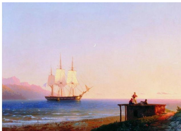
Фрегат под парусом 1838 г.(21 год)