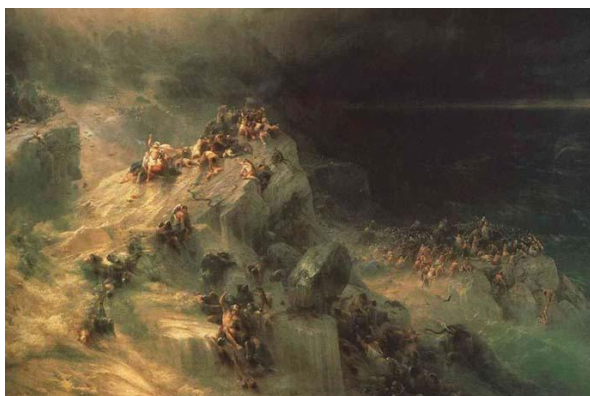
Всемирный потоп 1864 г. (47 лет)