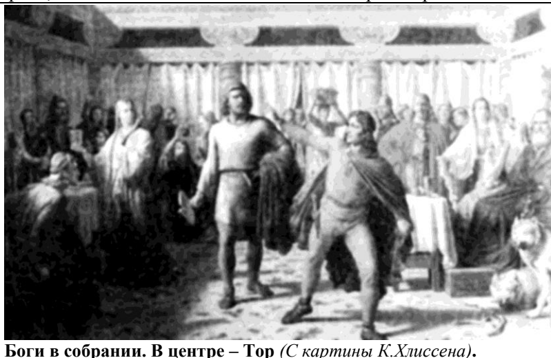
Боги в собрании. В центре – Тор (С картины К.Хлуссена).

Далее Мардук при помощи других богов создаёт людей из крови побеждённого им Кингу — мужа и соратника Тиамат. В «Эдде» боги под руководством Одина создают людей из дерева, однако во многом близкий людям род карликов боги творят «из Бримира крови и кости