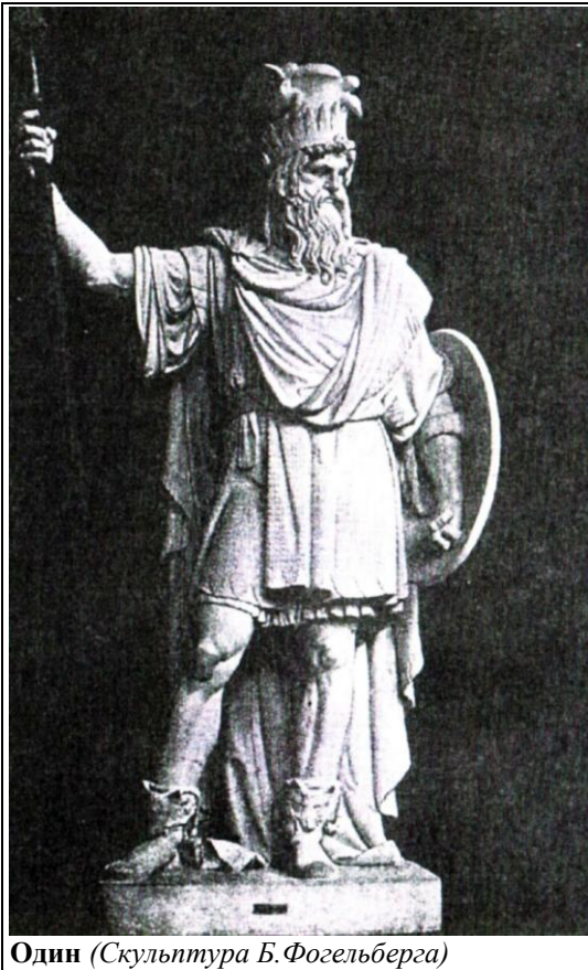
Один (Скульптура Б. Фогельберга)

Однако, в «Песне о Харбарде», принадлежащей к Старшей Эдде, Тор приписывает себе и убийство Тьяцци и помещение его глаз на небеса: