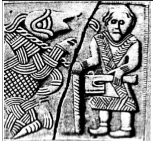
Воин (Тор?) и чудовище (Древнее изображение. Швеция).

Появление Тора на поле поединка, внезапно возникающего в сверкании молний, стремительно мчащегося (в колеснице) и мечущего боевой молот вполне соответствует описаниям Луга, Мардука, Зевса, Индры и Сканды: «Прибыл к месту сраженья Мардук в сверкании молний, прекрасный силой своей, уверенностью в победе», «...Зевс внезапно ринулся с неба в колеснице, влекомой крылатыми конями и, метая перуны, преследовал Тифона». Согласно Аполлодору, Тифон метал в Зевса горы, а тот отражал их, метая навстречу молнии [1, с. 10], что в точности соответствует столкновению в воздухе «скалообразующего» точила Хрунгнира с воплощающим молнию Мьельниром.