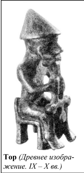
Тор (Древнее изображение. IX – X вв.)

жественной «Табели о рангах» и справедливым разрешением всех споров. Большинство известных по обеим «Эддам» богов являются детьми или потомками Одина. В процессе своих нелёгких трудов, Один приобретает магические знания, за что прозывается «мудрейшим» [6, с. 30–40].