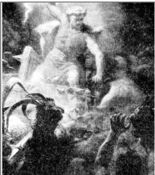
Тор в сражении с великанами (С картины М.Винге).

Большинство побед Тора и Индры обозначены кратко, о подробностях борьбы не сообщается. Однако в обеих «Эддах» всё же описан ход некоторых из конфликтов между великанами и богами. В основном он сводится к следующей схеме. Кто-либо из великанов, при помощи коварного бога-коллаборациониста Локи, выкрадывает у богов принадлежащие им священные предметы: волосы богини плодородия Сив, молодильные яблоки и саму богиню молодости Идунн, молот Мьёльнир. Всё это ведёт к очень плачевным последствиям для богов — земля лишается плодородия, боги начинают стареть или же, лишившись своего главного оружия, оказываются беззащитными перед угрозой со стороны великанов. Тогда богам удаётся заставить Локи действовать в их пользу. Локи, благодаря своей хитрости, устраивает великанам ловушки и боги (лично Тор) убивают покусившихся на их имущество великанов и возвращают похищенное.