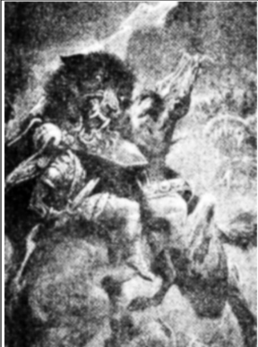
Один в битве с Фенриром (С картины М.Винге)

«А Фенрир Волк наступает с развёрстою пастью: верхняя челюсть до неба, нижняя — до земли. Было бы место он и шире бы раздвинул пасть. Пламя пышет у него из ноздрей. Мировой Змей изрыгает столько яду, что напитаны ядом и воздух и воды. Ужасен Змей и не отстаёт он от Волка. В этом грохоте расклевывается небо и несутся сверху сыны Муспелля» 7 [6, с. 90].