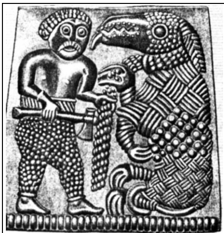
Воин в сражении с чудовищем (Древнее изображение. Швеция).

В числе порождений злой ведьмы-великанши — «Мировой Змей» Ёрмунганд, волк Фенрир, другие волки и змеи а также многоголовые тролли. С ними всеми боги вступят в свой последний бой.