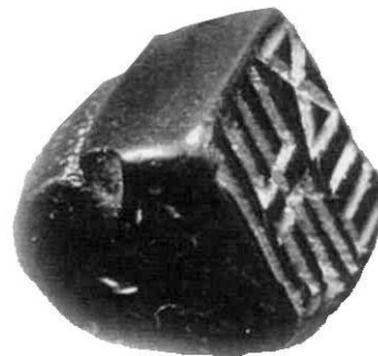
Фото 3. Печать цивилизации Анау.