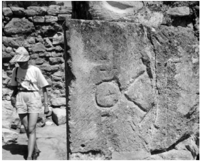
Фото 1. Знак № 19.